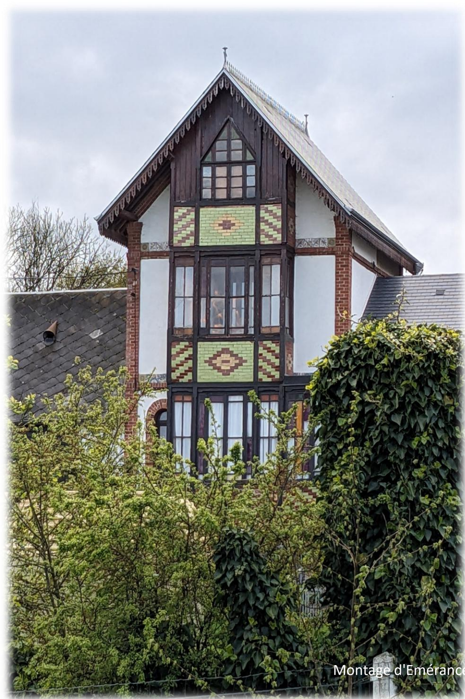
Montage d'Emérance Bétis - 17 avril 2024