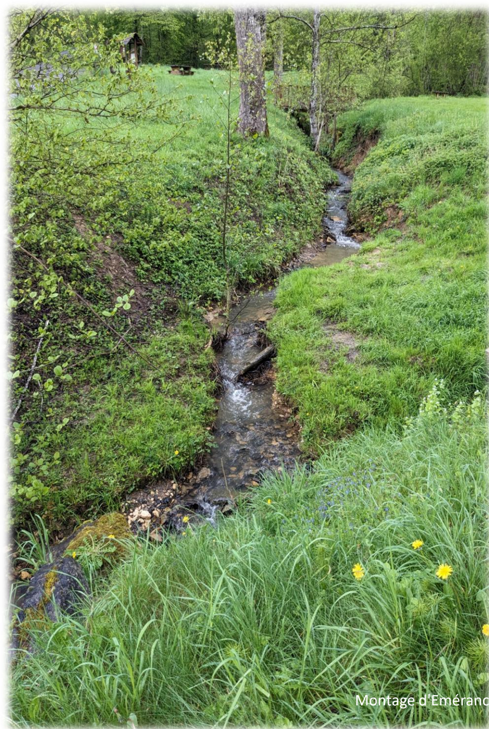
Montage d'Emerance Bétis - 17 avril 2024