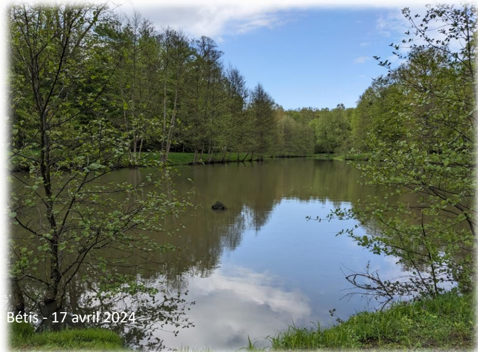
Montage d'Emeraude Bétis - 17 avril 2024