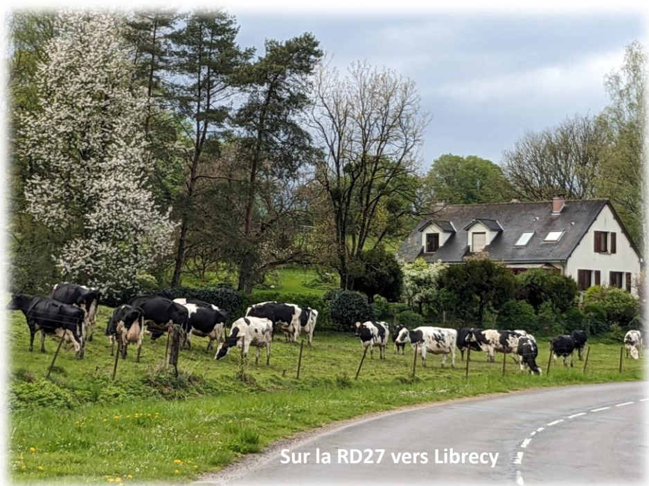
Sur la RD27 vers Librecy