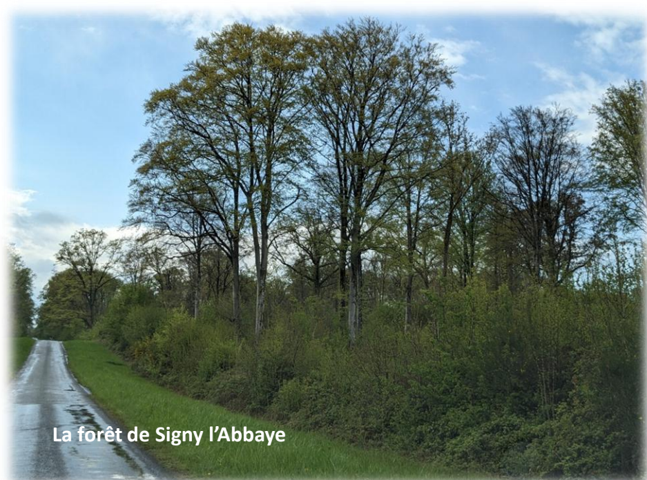
La forêt de Signy l'Abbaye