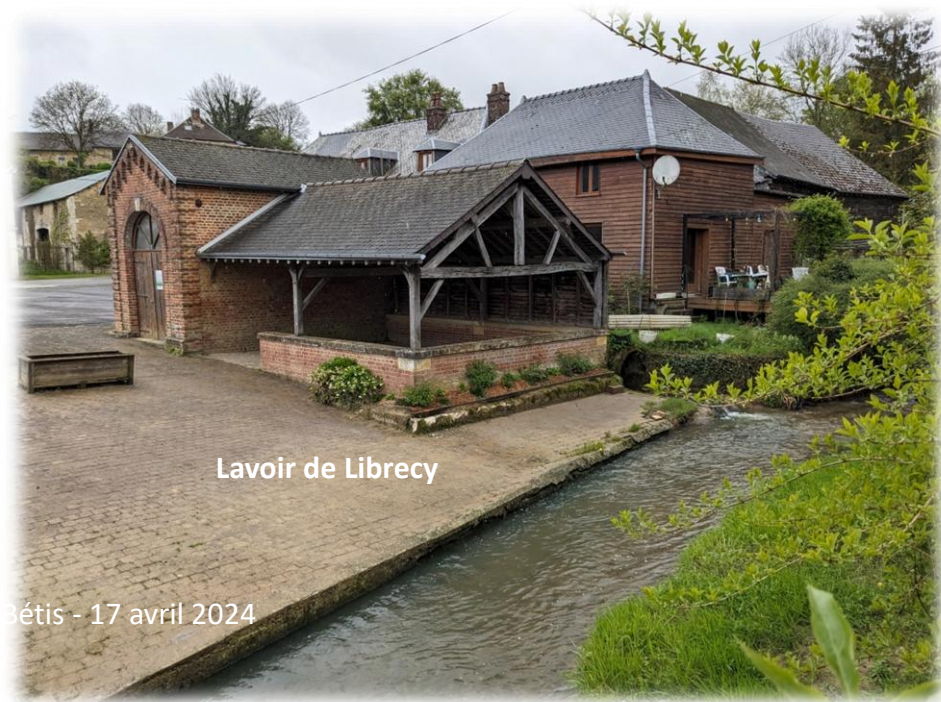
Lavoir de Librecy