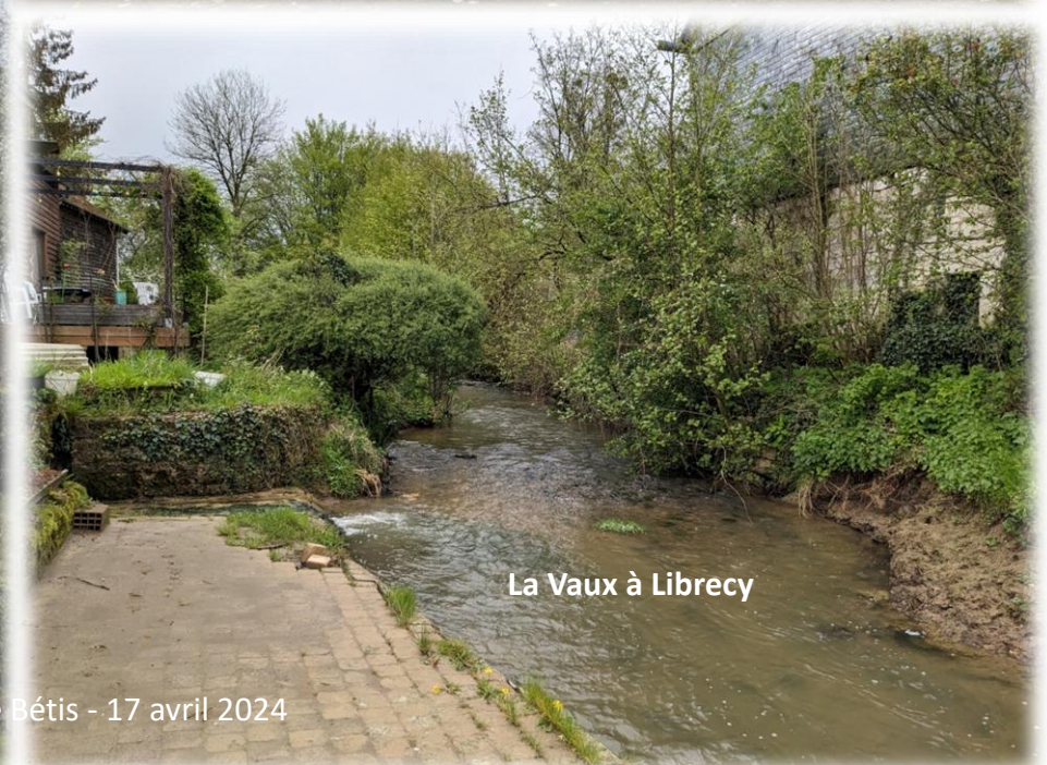
La Vaux à Librecy