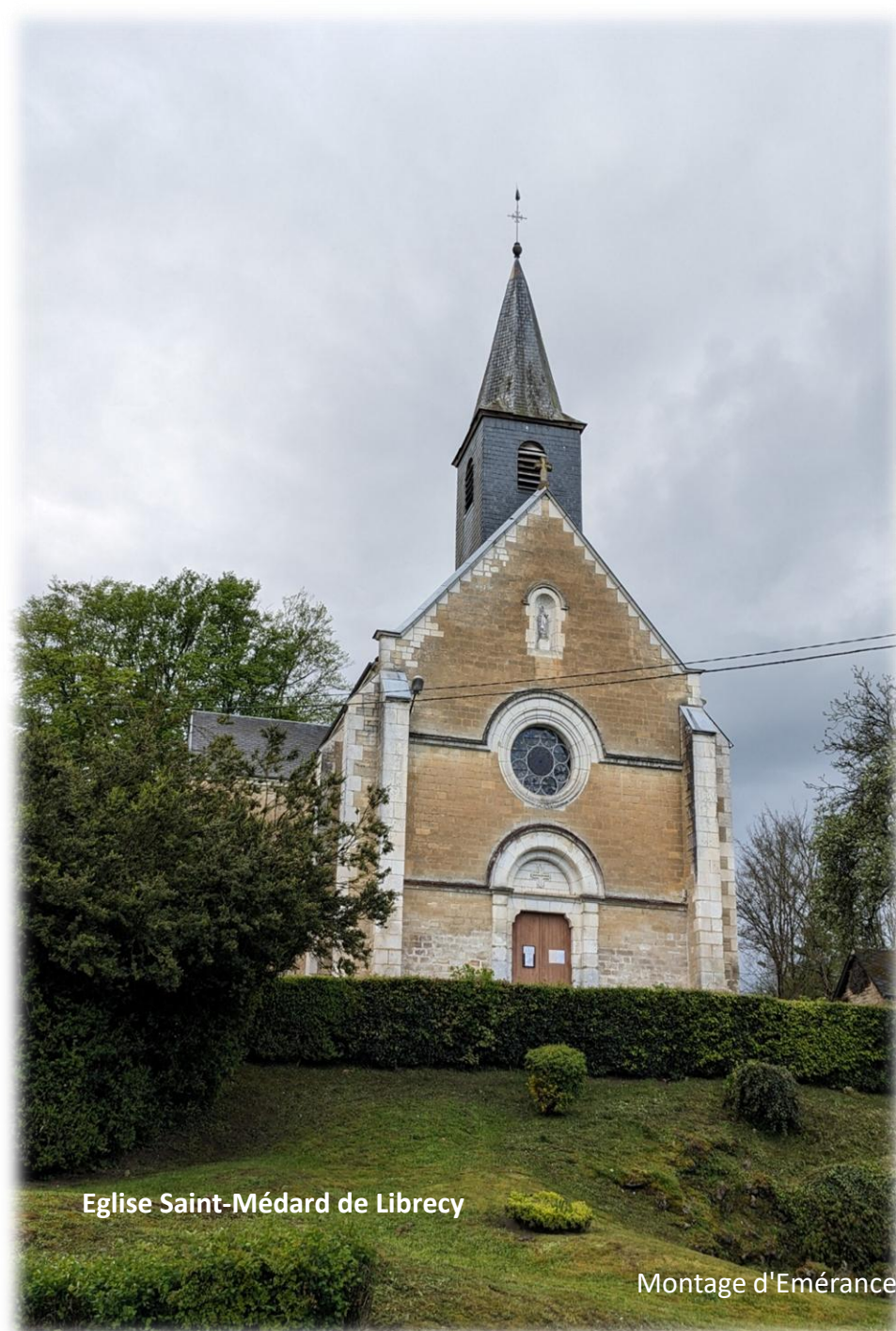
Eglise Saint-Médard de Librecy