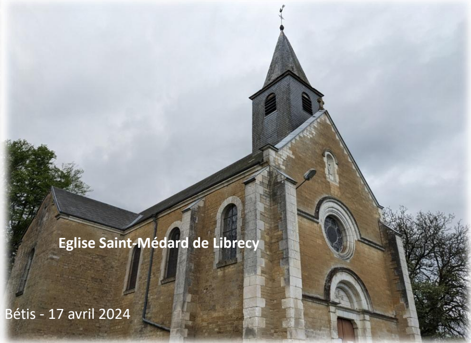
Eglise Saint-Médard de Librecy