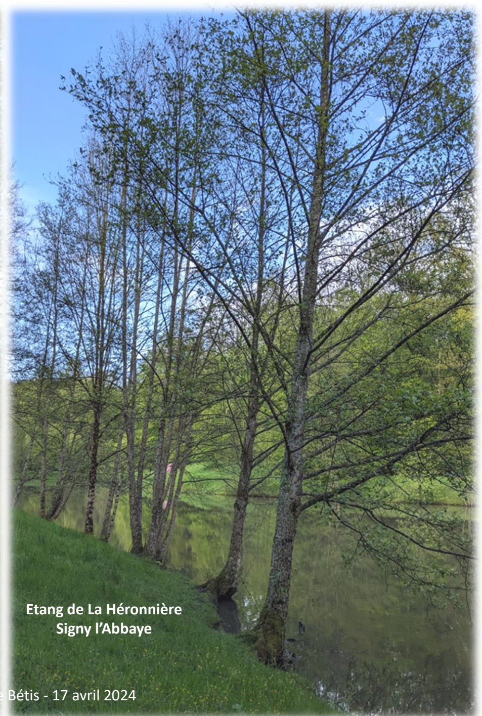
Etang de La Héronnière Signy l'Abbaye

17 avril 2024