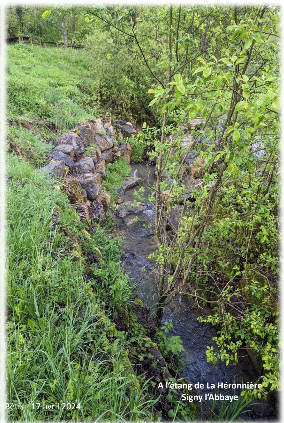
A l'étang de La Héronnière Signy l'Abbaye