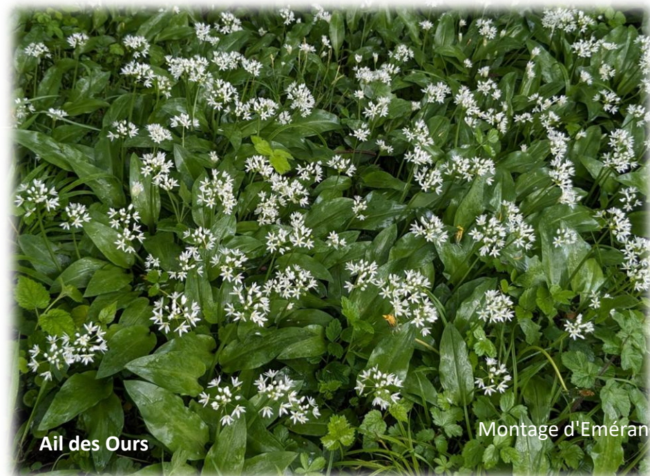
Ail des Ours