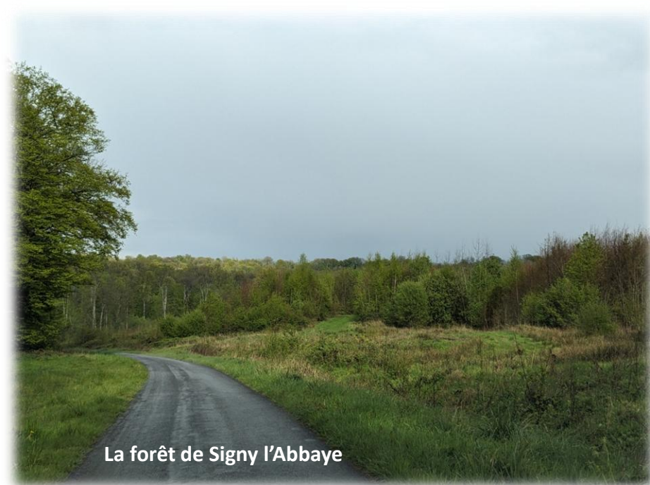
La forêt de Signy l'Abbaye