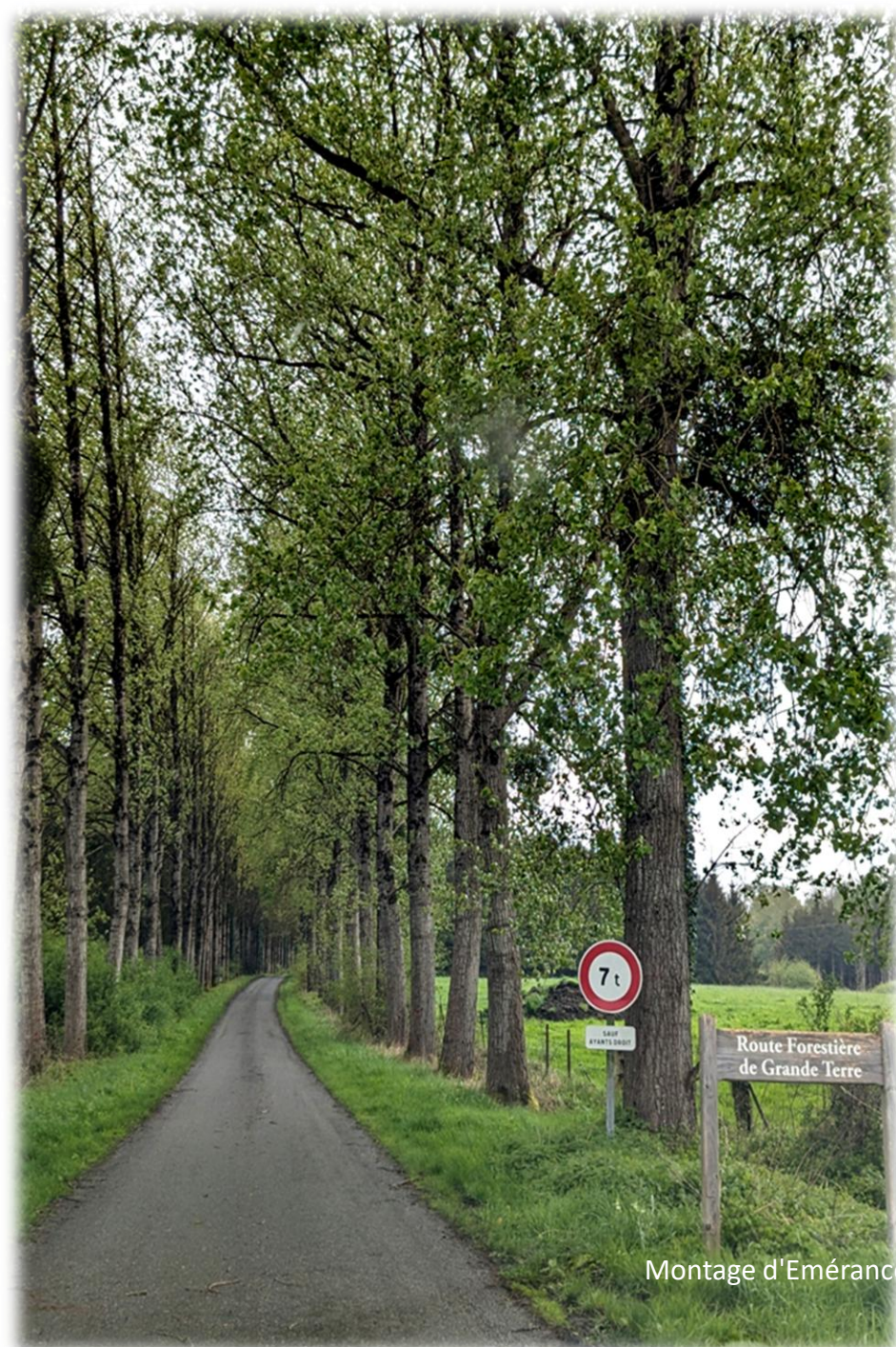
Montage d'Emérance Bétis - 17 avril 2024