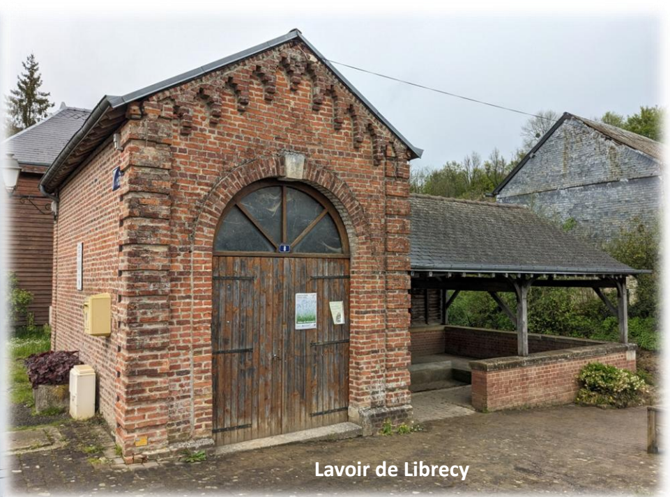
Lavoir de Librecy