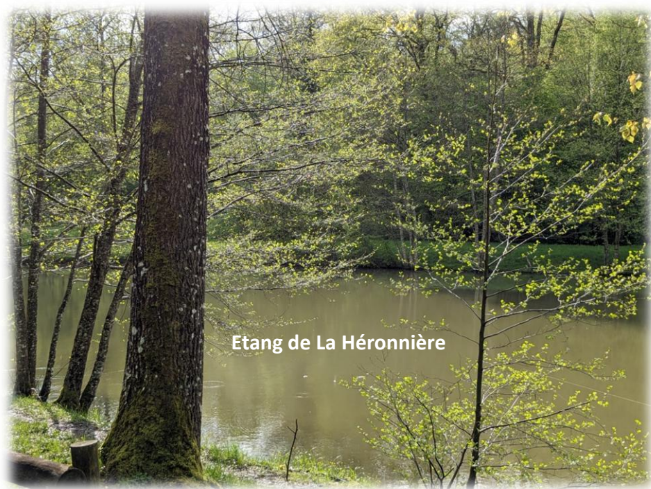
Etang de La Héronnière