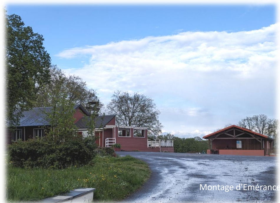
Montage d'Emérance Petit - 17 avril 2024