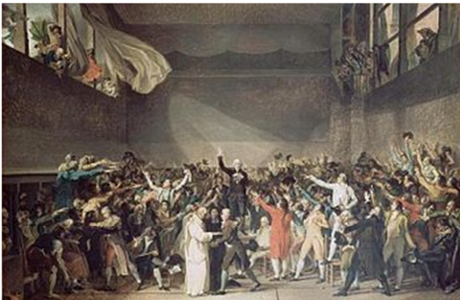
Serment du jeu de paume