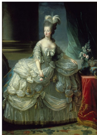
Louis XVI et Marie Antoinette