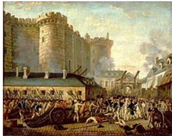
Prise de la Bastille