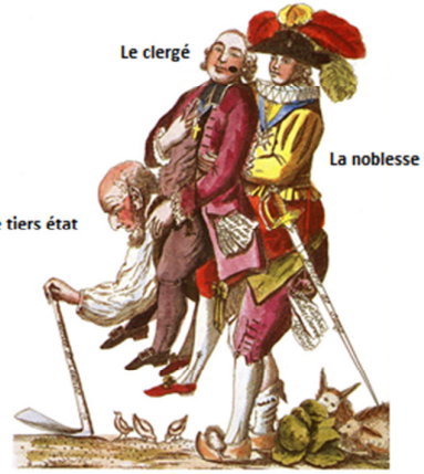
Les trois ordres (caricature)