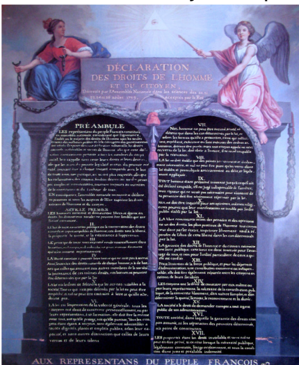
Déclaration des droits de l'homme et du citoyen

Ecrire les dates des documents ci-dessus.