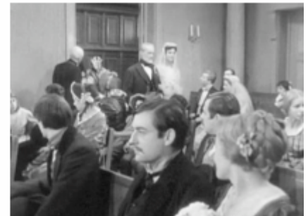
Gervaise (René Clément 1956)