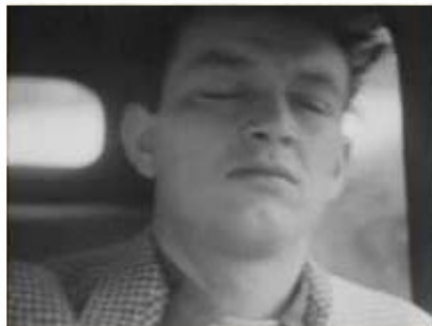
La règle du jeu (Jean Renoir 1939)