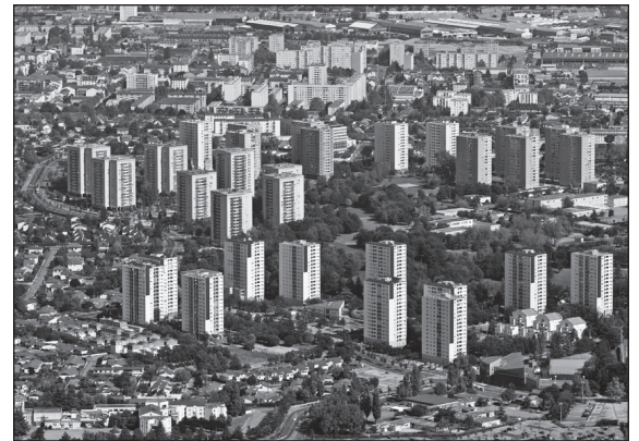
Doc. 2 Le quartier des Minguettes, grand ensemble résidentiel, 2012.

Aujourd'hui, des projets de rénovation urbaine essaient de rendre ces quartiers plus attractifs et plus agréables à vivre.