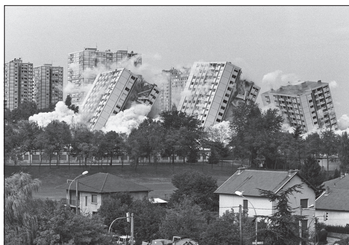
Doc. 7 Destruction de dix tours du quartier des Minguettes à Vénissieux en 1994.