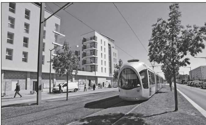
Doc. 3 Le tramway, un nouvel axe de développement du quartier.