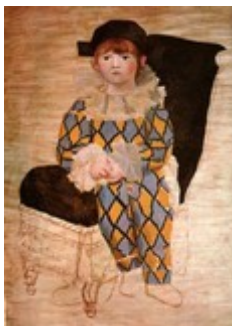
Pablo Picasso Paul en Arlequin 1924