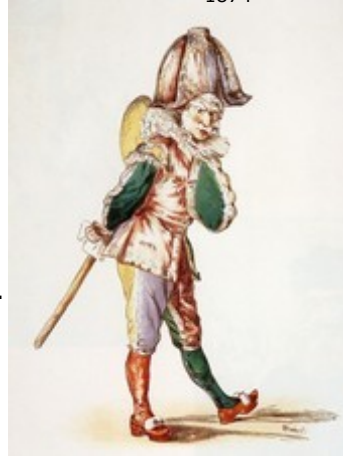
Édouard Manet Polichinelle 1874

La perruche disait : « J'aime peu son visage, Mais son charmant habit n'eut jamais son égal. Il est d'un si beau vert ! - Vert ! dit le cardinal ; Vous n'y voyez donc pas, ma chère ? L'habit est rouge assurément : Voilà ce qui le rend charmant. - Oh ! pour celui-là, mon compère, Répondit le serin, vous n'avez pas raison, Car l'habit est jaune-citron ; Et c'est ce jaune-là qui fait tout son mérite. - Il est vert. - Il est jaune. - Il est rouge morbleu Interrompt chacun avec feu ; Et déjà le trio s'irrite. " Amis, apaisez-vous, leur crie un bon pivert ; L'habit est jaune, rouge et vert. Cela vous surprend fort ; voici tout le mystère : Ainsi que bien des gens d'esprit et de savoir, Mais qui d'un seul côté regardent une affaire, Chacun de vous ne veut y voir Que la couleur qui sait lui plaire. "