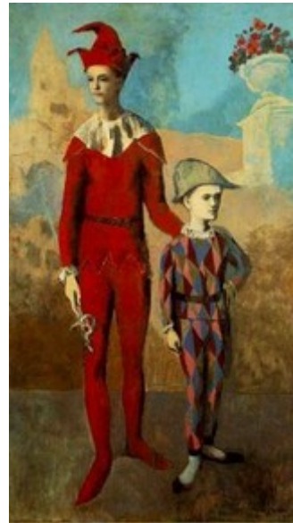
Pablo Picasso Acrobate et jeune Arlequin 1905