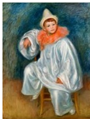
Pierre-Auguste Renoir Le Pierrot blanc 1901/1902