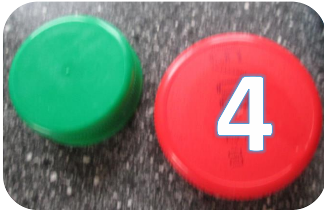
4 larges bouchons de couleurs différentes