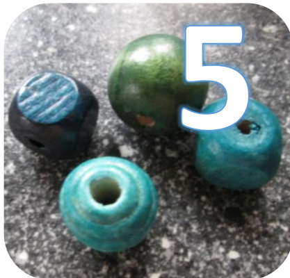
5 grosses perles