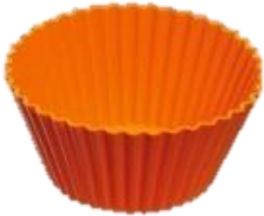
1 moule pour cupcake