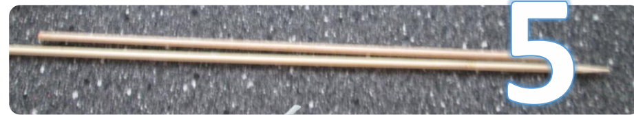
5 piques à brochette