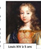
Louis XIV à 5 ans