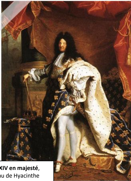
Louis XIV en majesté, Tableau de Hyacinthe Rigaud, 1701

1. Observe ce tableau de Louis XIV en majesté et réponds aux questions suivantes :