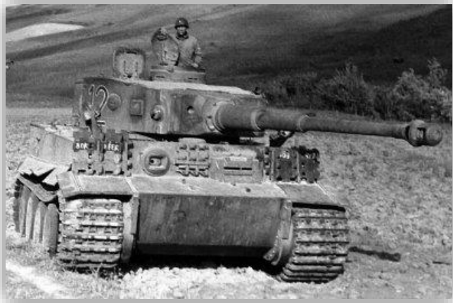
Doc 2 : Un char d'assaut

Près de 70 millions d'hommes de tous les continents et en particulier des colonies européennes ont été mobilisés. Les combats ont été terrestres, aériens et sous-marins. De nouvelles armes et de nouveaux véhicules de guerres ont joué un grand rôle dans les combats.