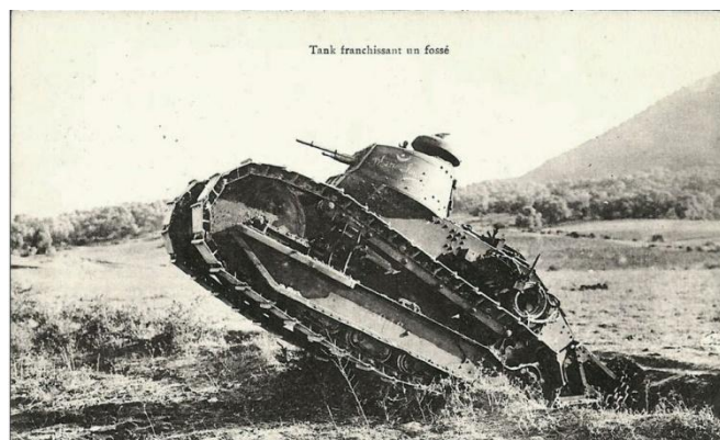
Char d'assaut produit à partir de 1918