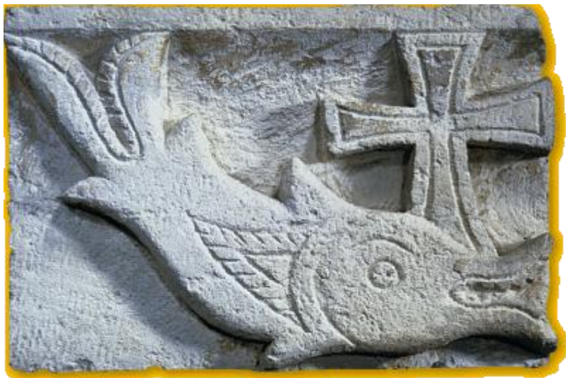
Le poisson : un symbole des 1ers chrétiens.