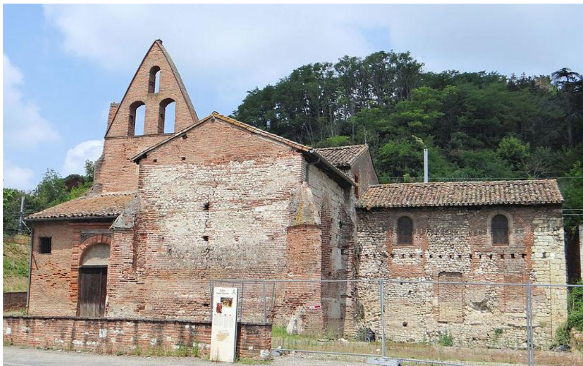
La plus ancienne église de France :