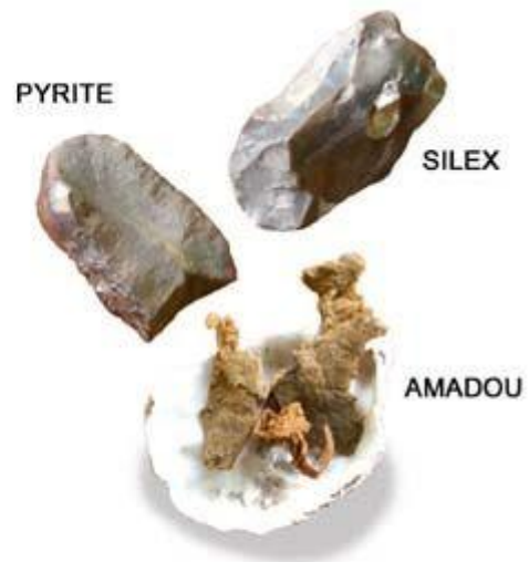
Allumage du feu par percussion