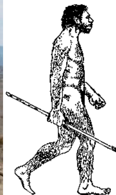
Homo sapiens neandertalensis

(photo d'hommes « déguisés » pour le tournage d'un film)