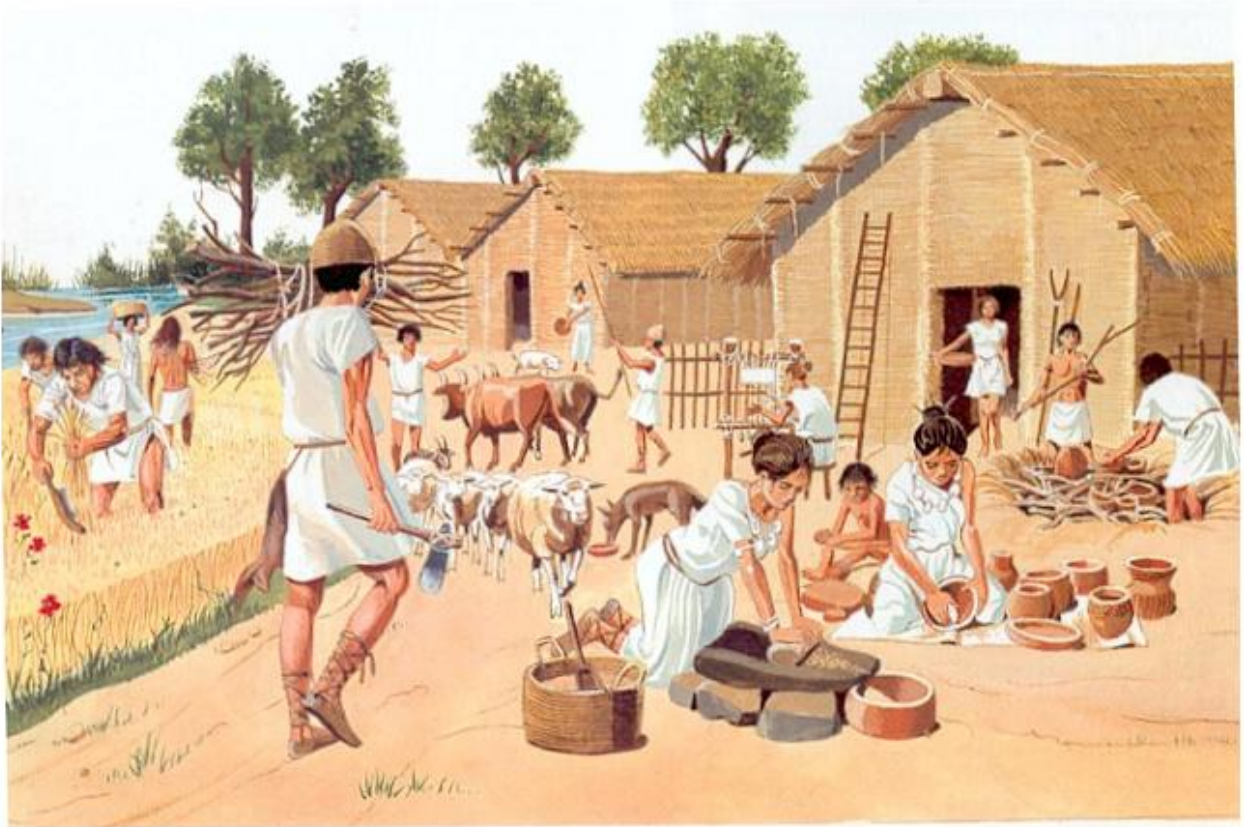
1. Reconstitution du village de Cuiry-les-Chaudardes dans l'Aisne (vers 4 000 avant J.-C.).