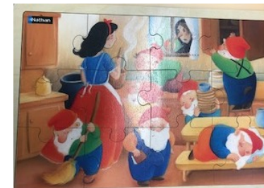
Blanche Neige 12 pièces