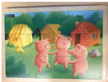
Les trois petits cochons 9 pièces