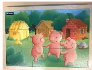
Les trois petits cochons 9 pièces