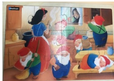
Blanche Neige 12 pièces