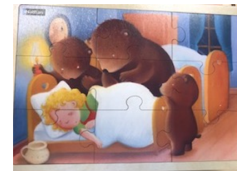
Boucle d'Or 9 pièces