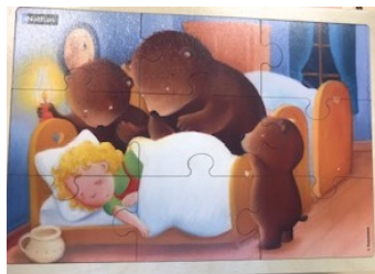
Boucle d'Or 9 pièces