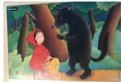
Le petit chaperon rouge 12 pièces