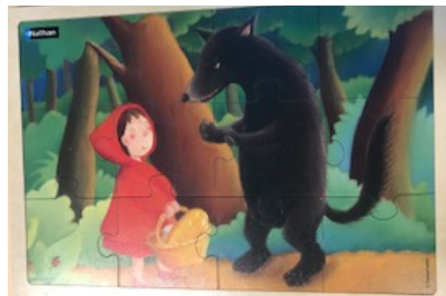
Le petit chaperon rouge 12 pièces