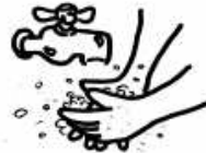
se laver les mains