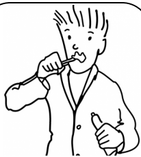
Se brosser les dents