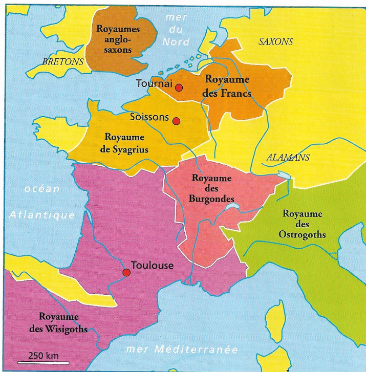
► Doc. 4 : Les royaumes barbares en Gaule.

❓ Repère les différents royaumes barbares sur la carte.