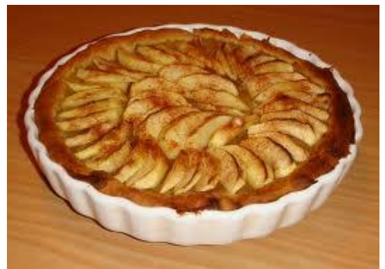
La tarte aux pommes