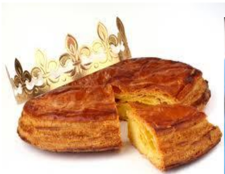
La galette des rois