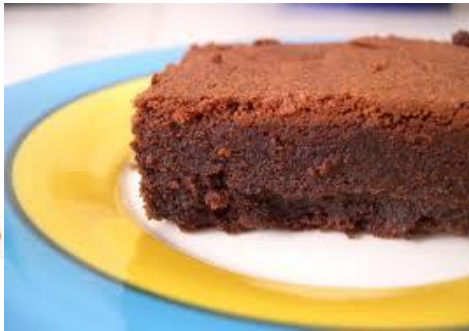
Gâteau au chocolat