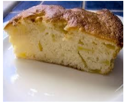
Gâteau yaourt et pommes