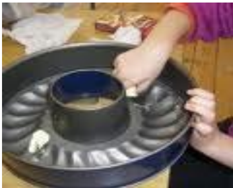
Beurrer un moule