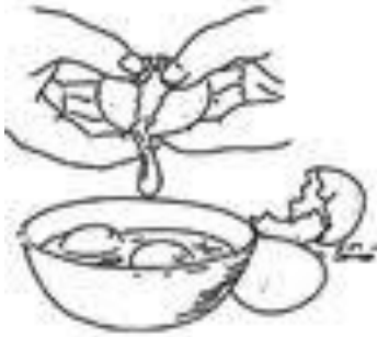
Casser les oeufs