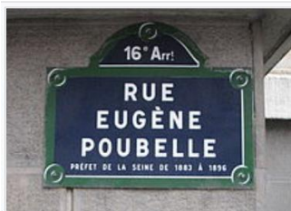
Plaquette de la rue qui porte son nom à Paris 16 e .