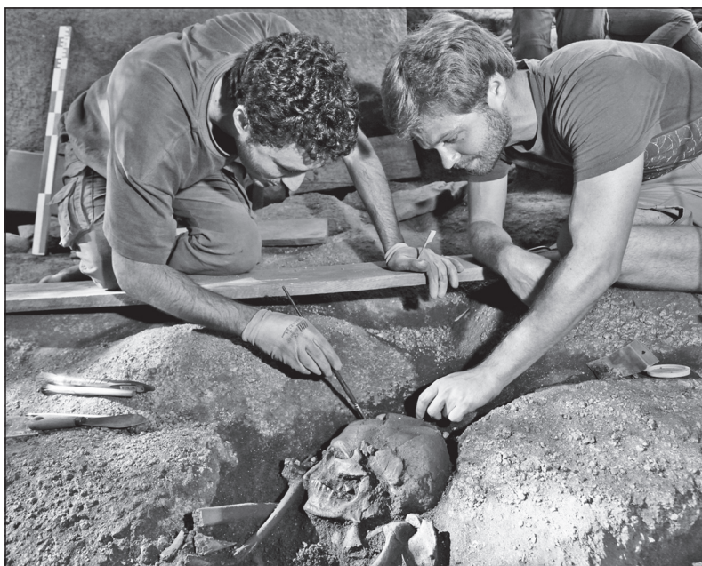
Doc. 6 Des archéologues dégagent les ossements d'un squelette vieux d'environ 9000 ans, 2011, Sottacaro (Corse).

D'après J. Leduc, V. Marcos-Alvarez, J. Le Pellec, Construire l'histoire , CRDP Midi-Pyrénées, 1994.