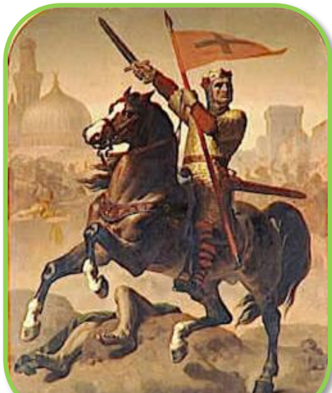
Représentation de Godefroy de Bouillon

Amuse-toi à reproduire cet étendard sur le quadrillage.