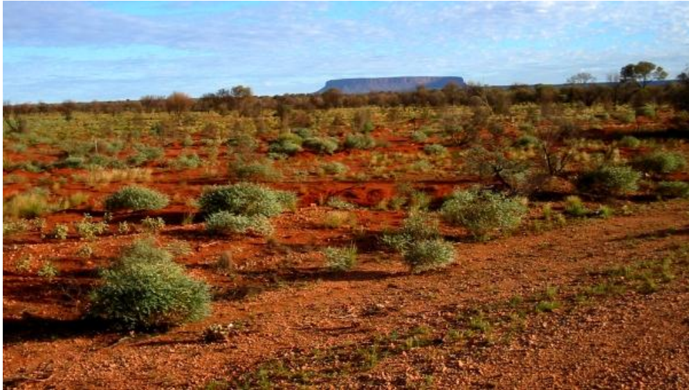
Le bush australien ou désert australien