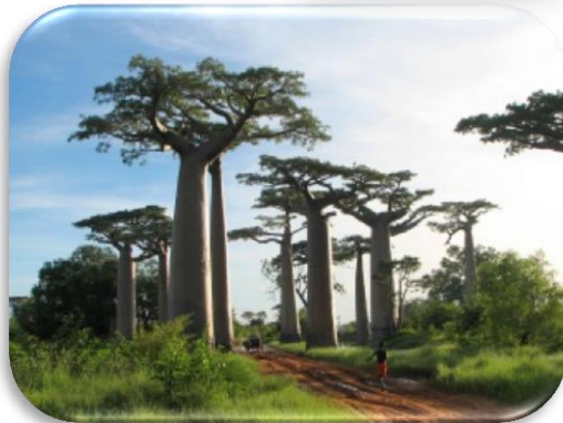
Photo dans son milieu de vie