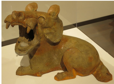
Chien - Dynastie Han Musée d'Honolulu

Certains chiens, considérés comme des dieux, ont fait l'objet de cultes. En Chine , des statues de chiens-lions étaient souvent placées à l'extérieur des temples, pour monter la garde et éloigner les mauvais esprits.