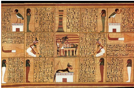
Livre des Morts, Égypte antique.

Certains chiens, considérés comme des dieux, ont fait l'objet de cultes. En Chine , des statues de chiens-lions étaient souvent placées à l'extérieur des temples, pour monter la garde et éloigner les mauvais esprits.