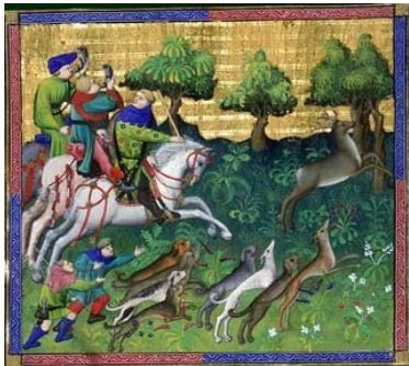
Le Livre de Chasse de Gaston Phébus Enluminure 1387 à 1389