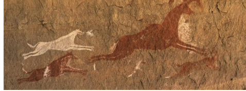
Site préhistorique d'Acacus, Lybie Entre 12 000 ans avant notre ère et 100 ans après.

Ces premiers chiens domestiques, certainement issus de loups et de chiens sauvages, étaient utilisés pour chasser ou pour effrayer les animaux sauvages dangereux. Les chiens devaient aussi protéger leurs maîtres pendant leurs longs voyages à la recherche de territoires de chasse ou de cueillette.