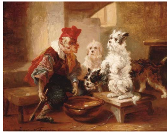
Zacharie Noterman 1808 – 1863 École des bonnes manières

Les deux chiens, qui avaient les yeux attachés sur leur camarade, se dressèrent aussitôt, et, se donnant chacun une patte de devant, comme on se donne la main dans le monde, ils firent gravement six pas en avant, puis après trois pas en arrière, et saluèrent la société.