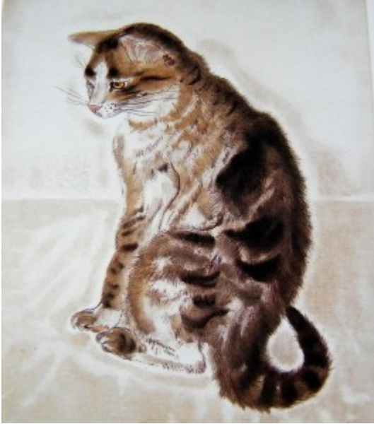
Foujita. Chat (1929)

1. « Le voilà ! dit le chat. Mais comment allons-nous faire pour le décrocher ?