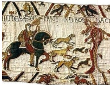
Tapisserie de Bayeux – XI e siècle

On utilise en général deux races principales de chiens : les ombriens et les molosses, mais aussi des dogues, des lévriers et des chiens courants.