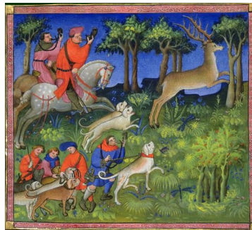
Livre de chasse Gaston Phébus – XIV e siècle

Le veneur est choisi jeune, vers 7 ans ; il devient valet vers 14 ans et à 20 ans, il devient aide. Un bon veneur doit savoir chasser, faire rentrer ses chiens sous bois. Il porte une tenue de cuir pour se protéger des épines et des ronces, un cor pendu au cou, une épée pendante à gauche et un couteau à dépecer.