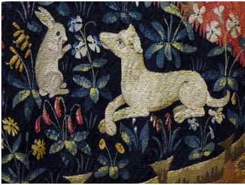
La Dame à la Licorne (détail) Tapisserie Fin XV e - début XVI e siècles.