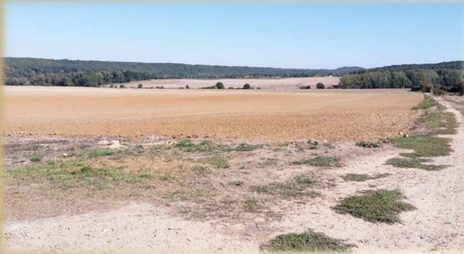
Immensité de la plaine de Jouars