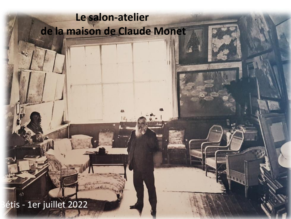
Le salon-atelier de la maison de Claude Monet