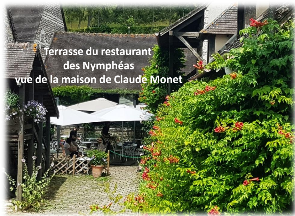
Terrasse du restaurant des Nymphéas vue de la maison de Claude Monet