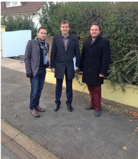
Porte à porte aux Martineaux