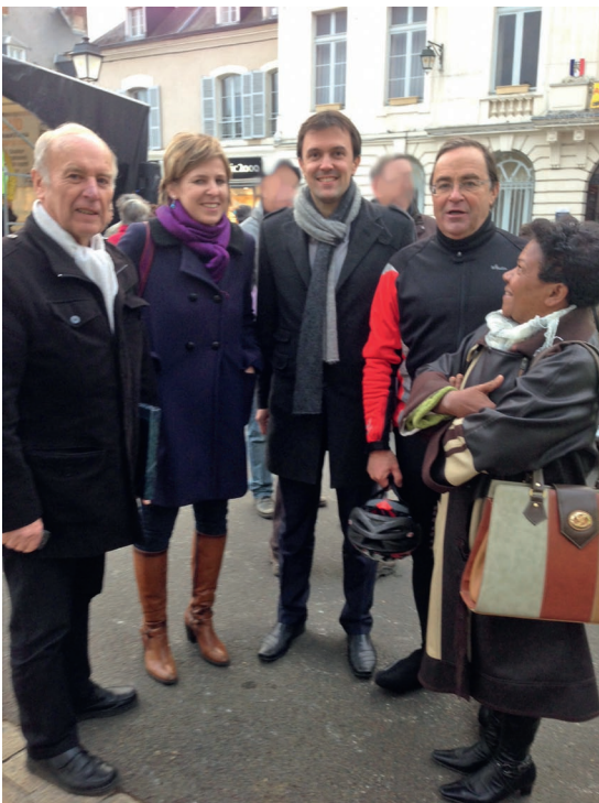
A l'arrivée du fil rouge vélo Téléthon, en décembre dernier