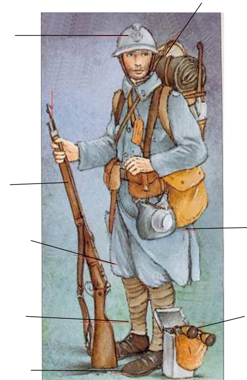
Poilu de 1915 Images Doc - Editions Bayard jeunesse - 96/97

4/ Complète la légende de ce poilu : un casque en tôle et cuir appelé Adrian, un fusil Lebel au tir plus rapide, une veste de drap, un barda de plus de 20 kg, un pantalon bleu horizon, des bandes molletières, un masque à gaz, des godillots cloutés