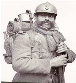
Des poilus dans une tranchée Une tranchée perfectionnée Un poilu

De longs boyaux creusés dans le sol, d'une profondeur de 2 mètres environ, recouverts de rondins de bois, de planches, de sacs à terre, laissant à leur partie supérieure d'étroits créneaux aménagés pour le tir.