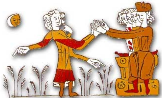
miniature anonyme du XIV ème siècle

Le seigneur, assis et entouré de sa cour, ferme ses mains sur celles de son vassal. Celui-ci est muni de trois autres mains ; de l'une il se désigne lui-même et des deux autres, il indique le fief (représenté par les épis) pour lequel il fait hommage.