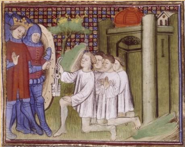
Les bourgeois de Calais, 1347 (Chronique de saint Alban du XV ème siècle)

Édouard III au siège de Calais (3 août 1347), d'après Les chroniques de Froissart, écrites de 1370 à 1400