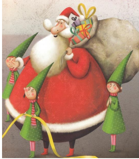
le Père Noël le Père Noël