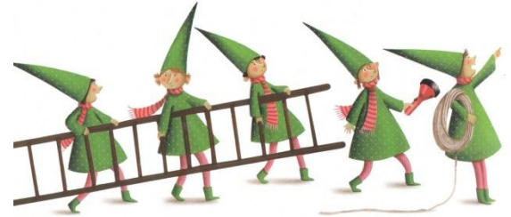
les lutins les lutins