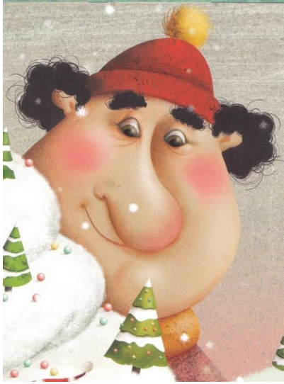
Boudinet le géant Boudinet le géant