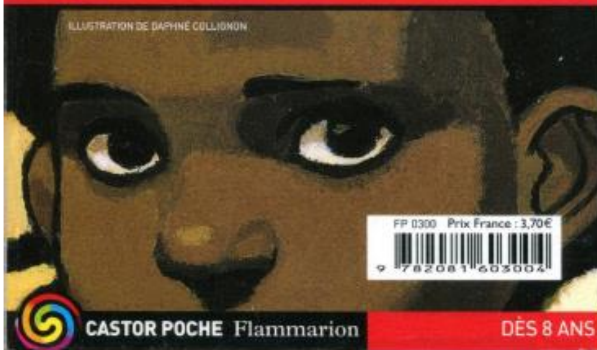
ILLUSTRATION DE DAPHNÉ COLLIGNON