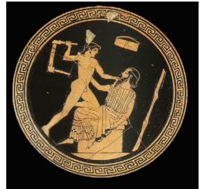
Héraclès tuant Linos

Linus : excellent musicien, il fut chargé d'enseigner la musique à Héraclès. Mais un jour que Linus s'était permis de réprimander son élève désobéissant, Héraclès tua son professeur.