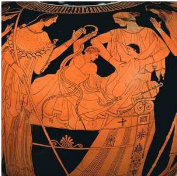
Héraclès, Iphiclès et les serpents @Musée du Louvre