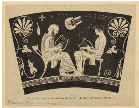
Linos et Iphiclès