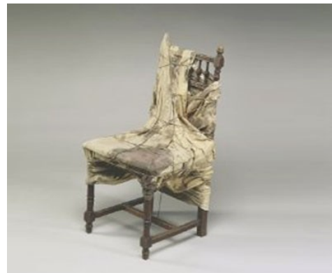
La chaise emballée de Christo