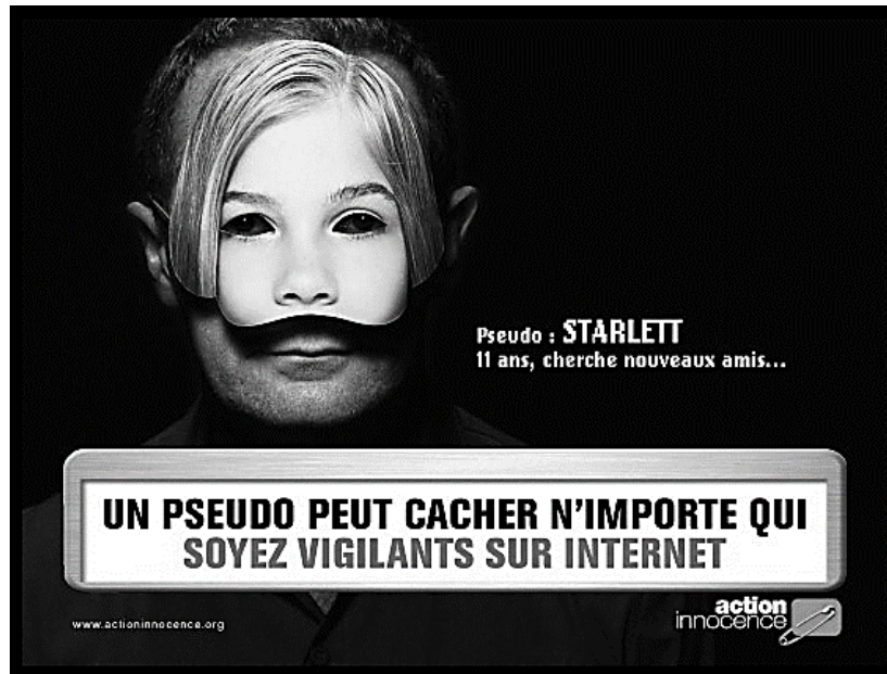
Campagne de sensibilisation aux dangers du Net.

Que peux-tu dire de l'affiche d'action innocence ci-dessus ?