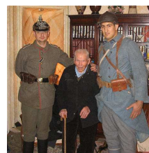
le dernier poilu

Attention ! Cette frise ne tient pas compte de la durée des périodes.