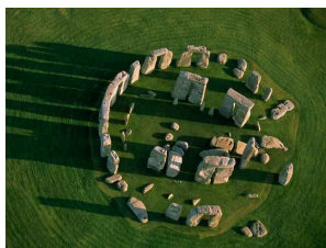
cercle de Stonehenge