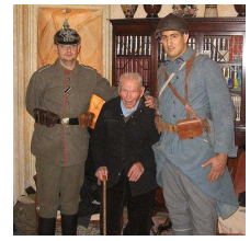
le dernier poilu source orale

Attention ! Cette frise ne tient pas compte de la durée des périodes.