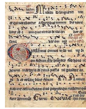
enluminure source écrite