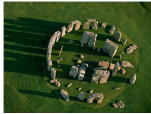
cercle de Stonehenge vestige