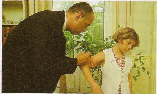
▲ Le B.C.G. protège les enfants contre la tuberculose, une maladie des poumons.

Le vaccin te permet d'éviter d'attraper certaines maladies graves.