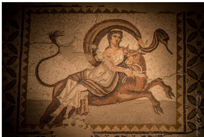
Document C : L'enlèvement d'Europe mosaïque trouvé à Byblos

Le mot « Europe » vient de la mythologie grecque. Zeus, le roi des dieux, métamorphosé en taureau, enleva la princesse de Tyr, Eurôpé (« celle qui voit loin ») pour l'emmener ente, une île de la Méditerranée. Les Grecs utilisèrent le mot « Europe » pour la première fois au Vème siècle avant J-C pour désigner les terres qu'ils découvraient peu à peu au nord du bassin méditerranéen.