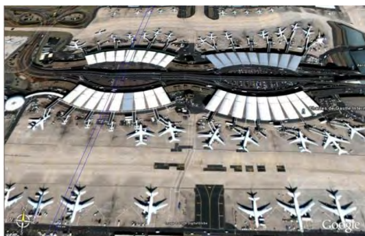
Doc.4 L'aéroport de Roissy Charles De Gaulle

En France, on peut se déplacer en avion pour aller de ville en ville. L'avion est rapide et permet d'aller loin : c'est aussi le seul moyen de circuler entre la métropole et l'outre-mer. Mais c'est le moyen de transport le plus coûteux et c'est surtout le moyen de transport qui consomme le plus d'énergie et qui pollue le plus. Les aéroports ont besoin de grands espaces pour leurs aérogares et pour leurs longues pistes de décollage et d'atterrissage. C'est pourquoi ils sont installés là où il y a de la place : à la périphérie * des villes. Pour se rendre dans les aéroports, il faut prendre la voiture, les transports en commun ou encore le train. En France, les villes importantes disposent toutes d'un aéroport. Elles sont donc reliées entre elles, mais aussi aux grandes villes