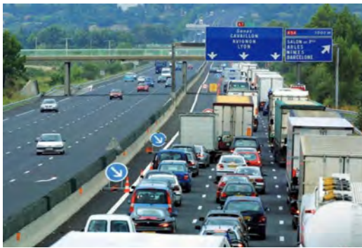
Doc.2 L'autoroute A7 ou "autoroute du soleil"

Des bus complètent le réseau pour atteindre les zones éloignées des gares. Le TGV, train à grande vitesse, roule à 320 km/h. Il relie les grandes villes françaises. Le réseau, longtemps organisé en étoile autour de Paris, permet désormais de traverser la France sans passer par Paris. Il permet également d'aller dans les pays voisins : en Belgique, en Allemagne, en Italie, en Espagne et même au Royaume-Uni grâce au tunnel sous la Manche.