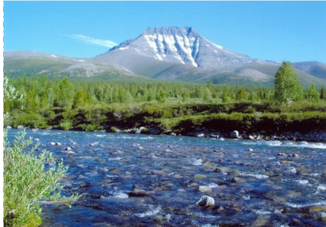
Alpes scandinaves ou Scandes (Norvège Suède Finlande)