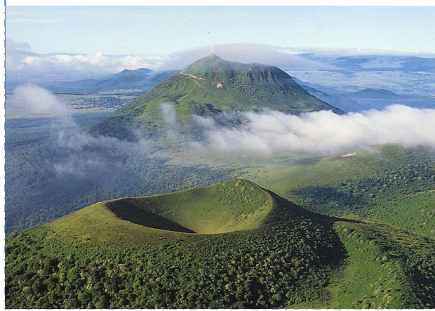
Pyrénées (France Espagne)