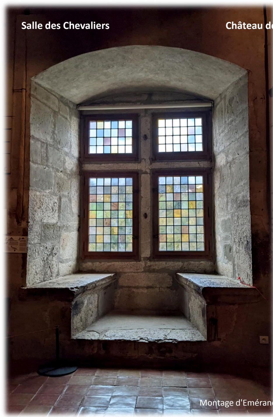
Cabinet du XVIIème