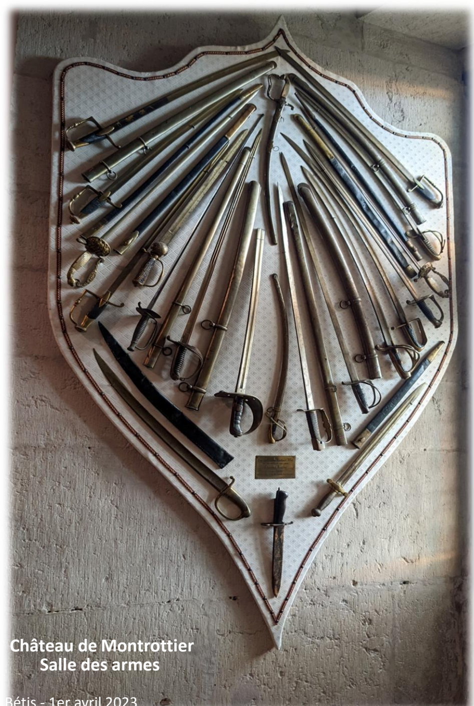
Château de Montrotier Salle des armes