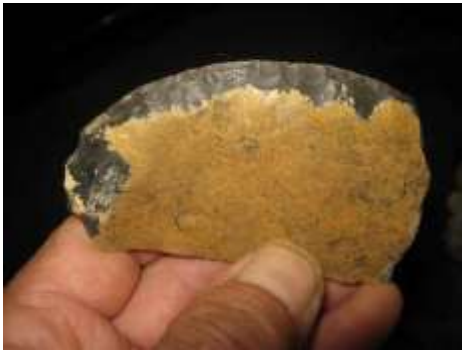
Un racloir en pierre