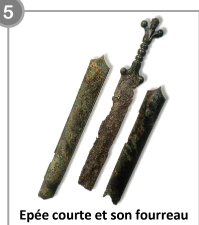
Epée courte et son fourreau