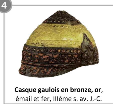
Casque gaulois en bronze, or, émail et fer, III e s. av. J.-C.

Textes issus de Histoire-Géographie CE2 (Hachette)