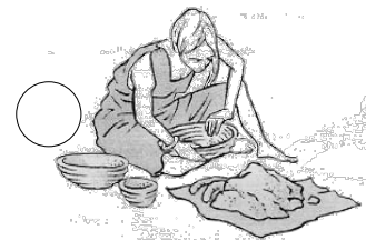
Fabrication d'objets en terre cuite

Ils ont découvert comment fabriquer des outils et des armes en métal qui ont peu à peu remplacé ceux en pierre.