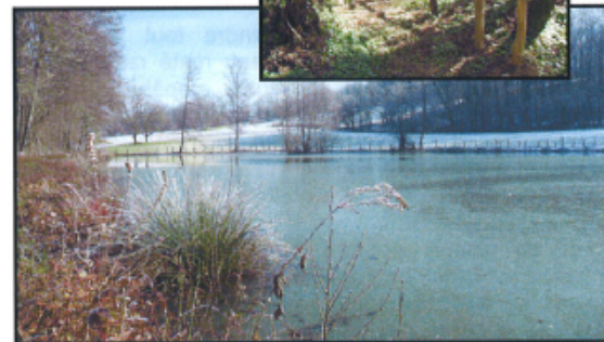
Description de l'itinéraire disponible au verso