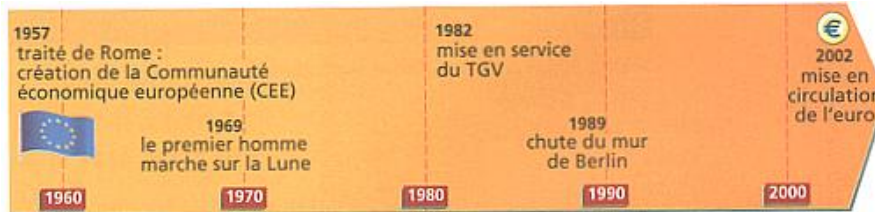
Frise chronologique historique moyenne