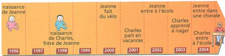
Frise chronologique de 2 enfants

Une frise chronologique peut porter une période plus ou moins longue. Il existe des frises chronologiques courtes (en années) et d'autres très longues (en siècles voir en millénaires).