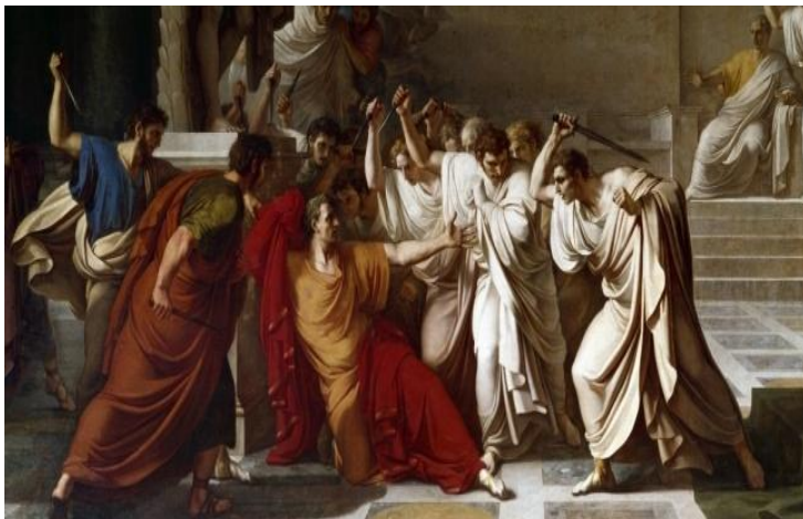
Assassinat de César aux Ides de mars – 44 av. J.-C

Après l'assassinat de Jules César, deux hommes revendiquent son héritage : Octave, son petit neveu et fils adoptif par testament, et Marc Antoine, son lieutenant. S'ils se lient dans un premier temps en s'attribuant chacun une partie du monde – à Octave l'Occident, à Marc Antoine l'Orient -, ils s'affrontent bientôt dans la célèbre bataille navale d'Actium. En 31 av. J.-C, Octave écrase la flotte d'Antoine et de la reine Cléopâtre au large des côtes de la Grèce. L'année suivante, Antoine se suicide en Egypte ainsi que Cléopâtre. L'Egypte devient province romaine. Le principat remplace la République et Octave prend le titre d'Auguste en 27 av. J.-C