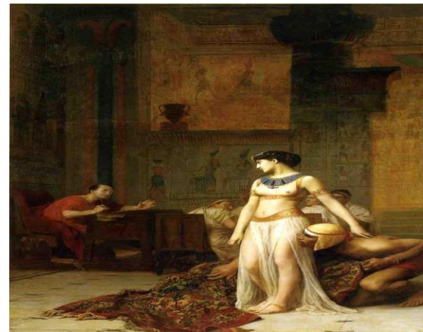
La rencontre de César avec Cléopâtre cachée dans un tapis, d'après la légende.