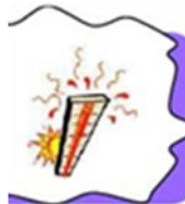
Il fait chaud.