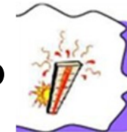
Il fait chaud.