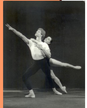
Quatre temp raments, Balanchine

* ces cours donneront lieu   une repr sentation en fin de 2  et 4  semaine . Pour prendre ces cours cr atifs, il est obligatoire de participer 2 ou 4 semaines et de prendre les cours de technique Martha Graham (pour r pertoire contemporain et/ou composition) ou classique (pour pas de deux Balanchine).