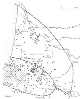
OS, OST, OUST, OSSE, OUSSE.