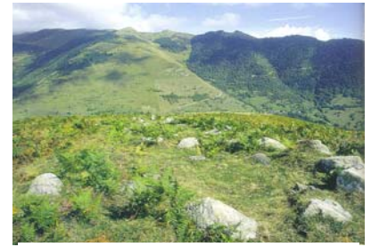
!ci qît ARBA. Montagne de Lespiau : 'Le Pantheon LARBOUSTOIS'

Vous avez remarqué la symétrie B-AR/AR-B présentée par la racine de ces deux vallées du Comminges. Elles ne constituent pas chacune un 'atome' indivisible, mais une molécule composée de deux atomes. On peut les séparer chacune en deux atomes nouveaux distincts : B et AR . Dans un numéro précédent du Petit Commingeois, nous avons déjà expliqué que l'ARBOUST » est le pays « OUST » de la vieille femme « ARBA » que nous avons dissociée : « AR » signifiant précédent et « BA » femme. Ces derniers mots sont les plus anciens, car ils déterminent des rapports familiaux. Ils ont été utilisés pour former plus tard un mot définissant un lieu géographique, la Vallée de l'ARBOUST.