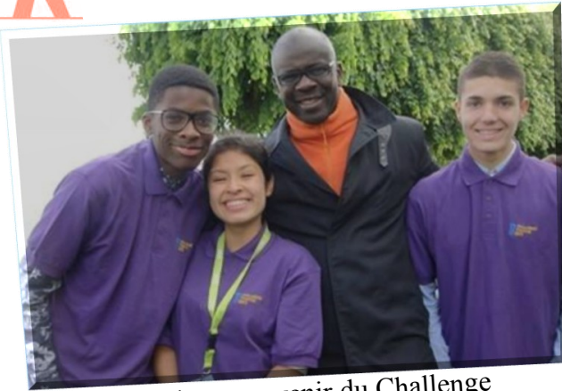
Une photo souvenir du Challenge Thuram bien sympathique !