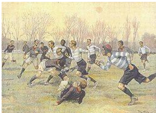
Stade français en 1890