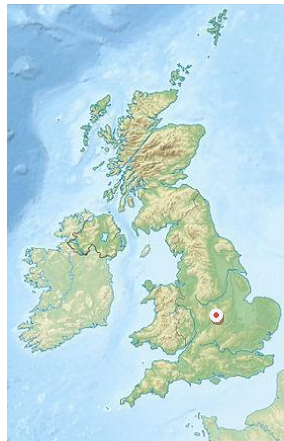
Rugby, ville d'Angleterre

C'est un apprenti boucher écossais, en 1883, qui a eu l'idée d'organiser un tournoi de rugby à effectif réduit et ne durant que 15 min pour aider le club de Melrose.