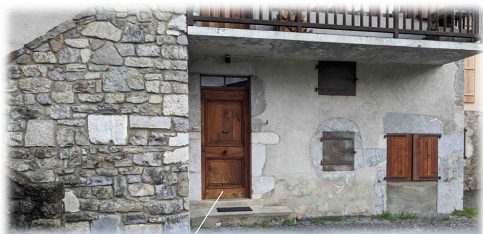
Entrée appartement vendu