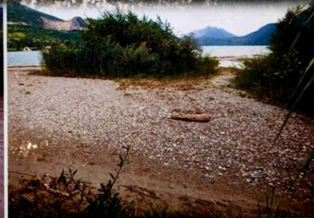
L'Ire en crue