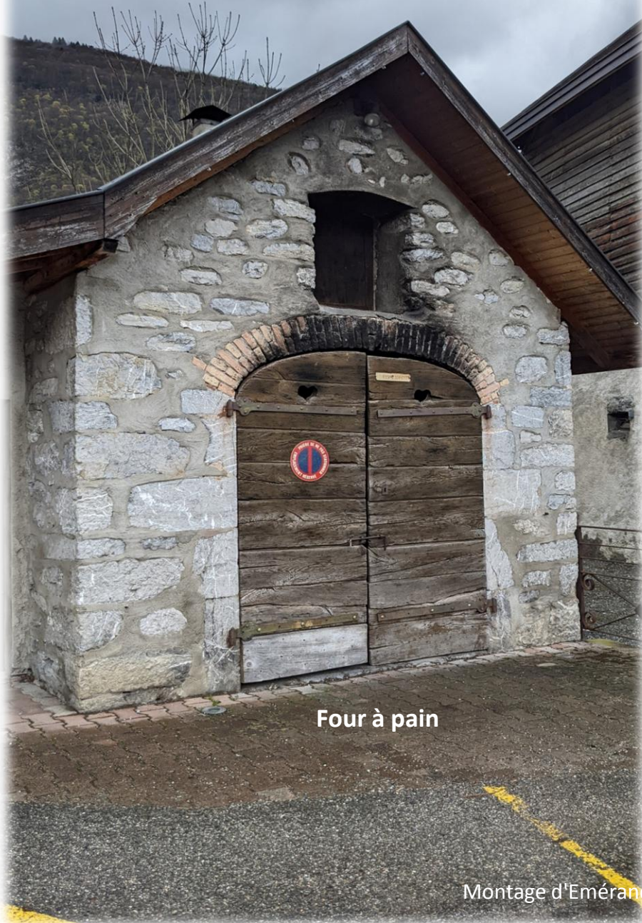
Four à pain