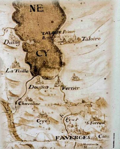
Extrait de la carte des biens de Tamié (1706)

Menacée par l'Ire, ruinée par les inondations pendant des siècles, la Vieille Eglise, première église de Doussard, jadis à quelques mètres des bords du lac , fut abandonnée vers 1732 et reconstruite à MÔCHERJINE (Doussard actuel).