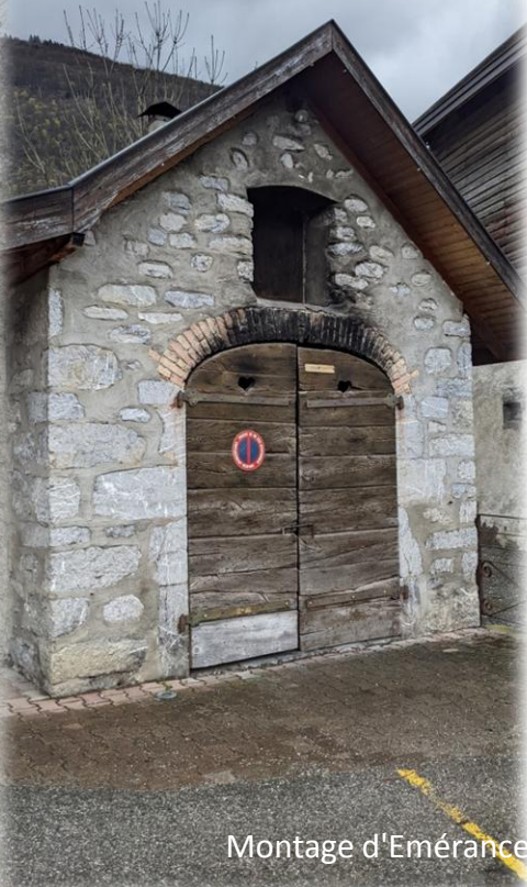
Montage d'Emérance Bétis - 27 mars 2023